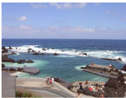
Meerwasserschwimmbecken bei Porto Moniz