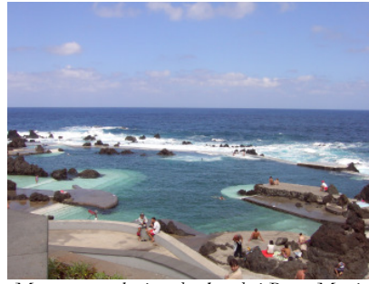
Meerwasserschwimmbecken bei Porto Moniz